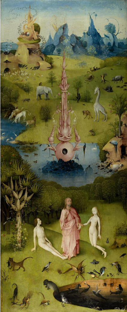
Triptyque Le Jardin des délices volet de gauche : Le Paradis

Inspiré de l'œuvre éponyme du peintre de la Renaissance Jérôme Bosch, Le Jardin des délices est le premier d'une série de trois projets que vous propose l'Orchestre Valaisan Amateur (OVA) cette saison, à la découverte des personnages sonores de l'orchestre: les cordes, les percussions et les vents.