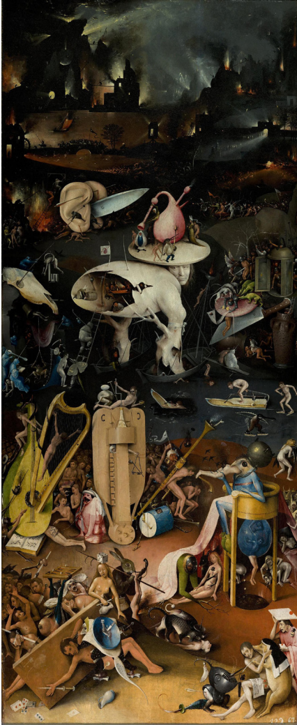
Triptyque Le Jardin des délices volet de droite : L'Enfer

Bosch lui-même suggère une dimension sonore par les nombreuses représentations d'instruments, de chanteurs et même d'organes auditifs, en particulier sur le volet de... l'enfer !