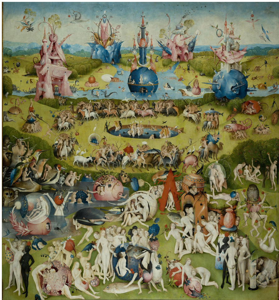
Triptyque Le Jardin des délices partie centrale : L'Humanité avant le déluge