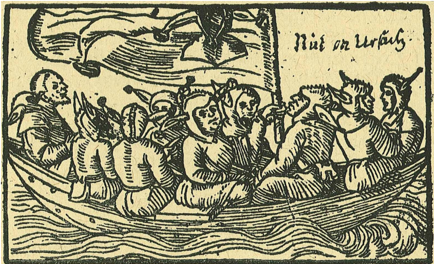
La Stultifera Navis en route pour le Pays des Fous - Gravure sur bois de 1549

Si l'ouvrage est publié à Bâles c'est que Brant, lui, n'est pas fou. Il connaît la réputation de cette ville pour le carnaval, qui attirait déjà les foules il y a 500 ans. Le succès de son œuvre est immense à travers l'Europe, notamment grâce aux gravures qui illustrent l'ouvrage et le rendent accessible au plus grand nombre. Bonnets d'âne, perruques, masques, c'est le royaume des bouffons à grelots et des charlatans en tous genres. « Ne t'imagines pas que nous soyons les seuls au monde à être fous : nous avons des confrères... », telle est la devise de La Nef des fous . Ou comme on le dirait aujourd'hui, plus on est de fous, plus on rit !