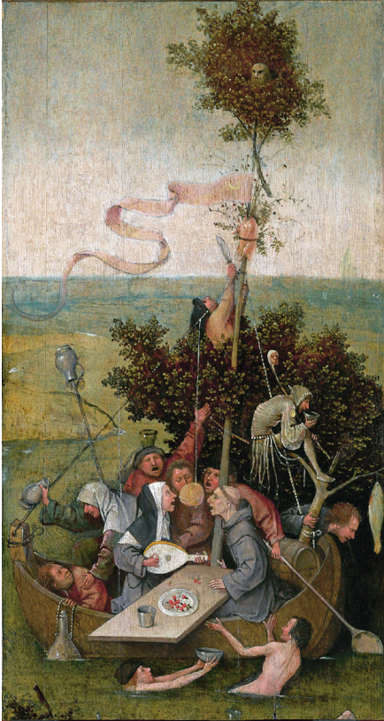
Jérôme Bosch, La Nef des fous

Eh bien voilà qu'à l'OVA, nous avons pris ce dicton au pied de la lettre, en nous associant au Conservatoire cantonal du Valais (en particulier avec l'Ensemble de percussions) pour construire notre propre nef et réunir les plus fous d'entre nous.